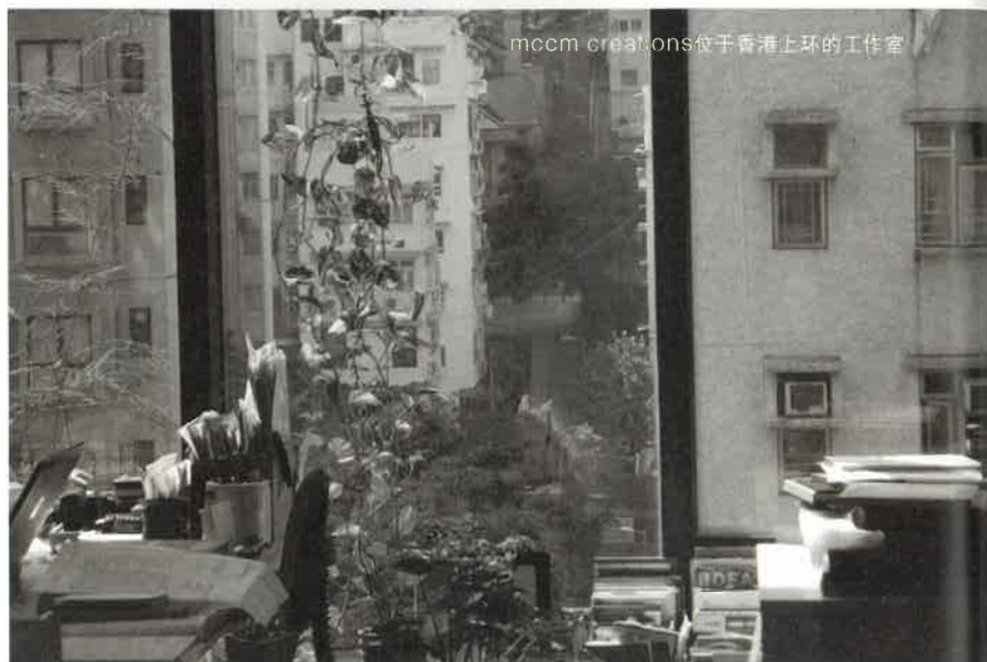
mccm creations位于香港上环的工作室

TEXT: XANTHE EDITOR: ELLEN